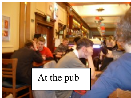
At the pub

Nach den vielen Wachsfiguren, den lebenden Menschen und den Scheintoten im „Chamber of Lights“ (gruselig – das mittelalterliche London!!!) kauften wir jede Menge Postkarten, die wir dann im Pub „Metropolitan“ schrieben, während wir auf unser vorbestelltes Essen warteten. Wir genossen „Fish and Chips“ oder Hamburger“.